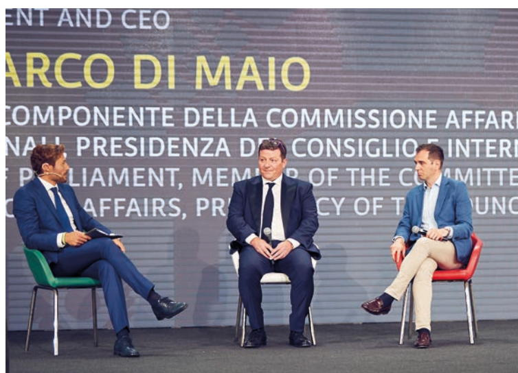
Il momento del dibattito con la presenza insieme a Gianluca Marchetti dell'Onorevole Marco di Maio

«L'espansione in atto dei nostri mercati di sbocco - prosegue Marchetti - è frutto di importanti investimenti non solo sulla rete commerciale, ma anche sulla nostra struttura produttiva: ogni anno, il 10% del fatturato viene impiegato per acquistare nuovi impianti, in aggiunta o in sostituzione di quelli già presenti. Nel 2022 abbiamo fatto anche di più, toccando il 20% del fatturato per ammodernare il nostro parco macchine, avvalendoci delle agevolazioni fiscali legate a Industria 4.0 e ad alcuni bandi di Invitalia. In particolare, non ci siamo limitati ad acquistare centri di lavoro