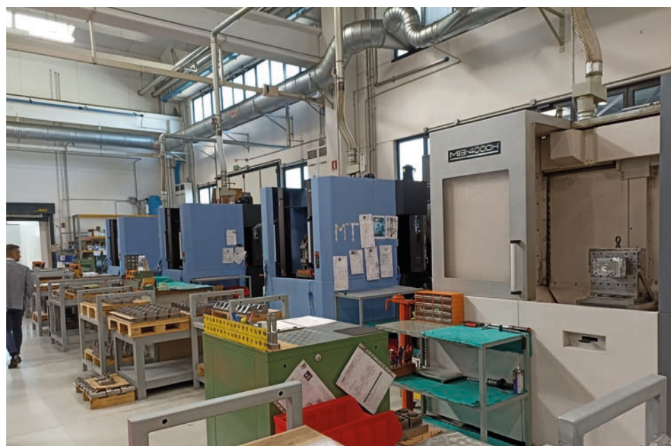
La continua crescita delle competenze tecnologiche e il costante aggiornamento del know how sono alla base del successo della MT

meccaniche del nostro territorio, da alcuni anni portiamo gli studenti del 4° e 5° anno nelle nostre fabbriche per coinvolgerli in attività di azienda. Qualche risultato l'abbiamo già avuto: gli istituti tecnici coinvolti hanno visto incrementare le iscrizioni di circa il 15% e alcuni studenti che avevamo accolto hanno scelto di entrare nelle nostre aziende, portando con sé alcune conoscenze di base che avevano già appreso durante il progetto. È un ottimo risultato destinato a crescere, perché i giovani