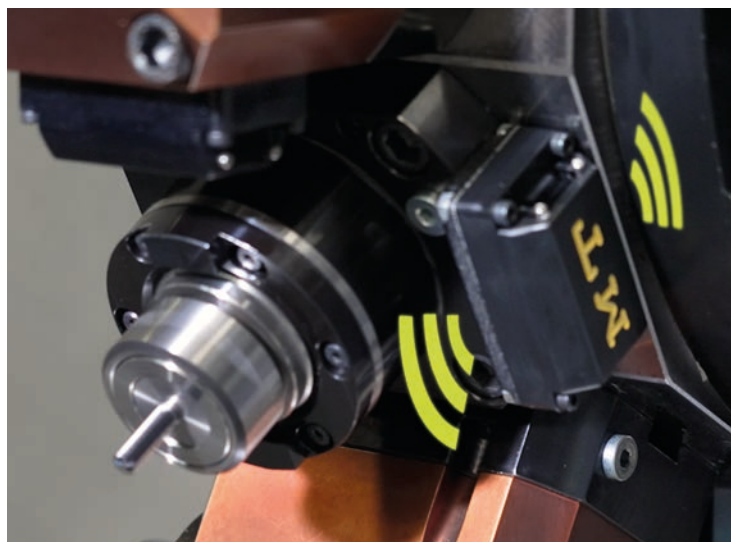
Da sinistra: una torretta attrezzata con i prodotti realizzati dalla MT e MT-SmartLife motorizzato con manutenzione connessa NB-IoT

di rilevamento dati sui motorizzati siamo riusciti a dare voce anche a un pezzo meccanico, creando una nuova frontiera nella manutenzione predittiva che, grazie al cloud, possiamo gestire noi da remoto oppure il cliente con un pc installato a casa sua».