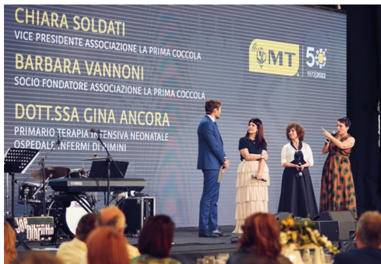
Consegna della donazione all'associazione La Prima Coccola e al Primario di terapia intensiva neonatale di Rimini

stanno finalmente capendo che nella nostra azienda si respira aria di futuro, di innovazione e di digitalizzazione».